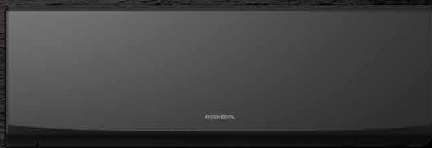
Unità interne: ASHH07/09/12/14KJCALB