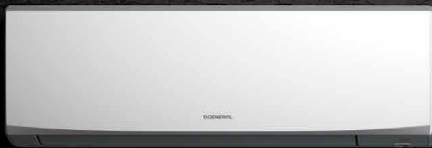
Unità interne: ASHH07/09/12/14KJCAL